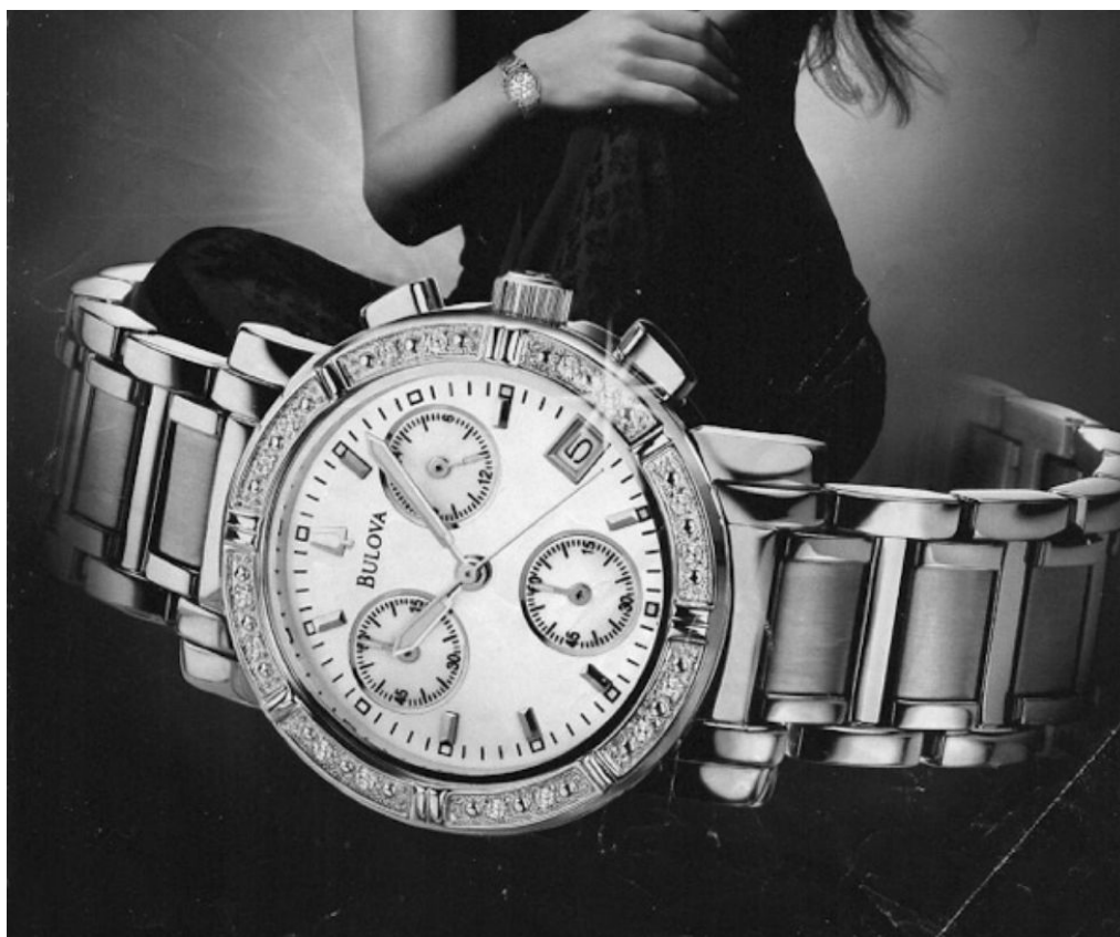
Art / Virgil Vernier fait reset Photo Extraites du livre «Arcana 1» de Virgil Vernier

Il est temps d'entamer une archive des rebuts iconographiques de notre présent. A l'époque où toutes les images du monde semblent accessibles en deux clics de souris sur Google Images ou Pinterest, la démarche peut apparaître incongrue, voire redondante. La vitesse à laquelle les images circulent dans l'actualité et disparaissent dans la pléthore en un battement d'ailes de papillon devrait pourtant nous mettre la puce à l'oreille : si rien n'est fait du côté des historiens et des artistes, c'est notre contemporain imagier tout entier, avec les codes qui nous permettent de le déchiffrer, qui menace de s'évaporer et de devenir illisible aux générations futures.